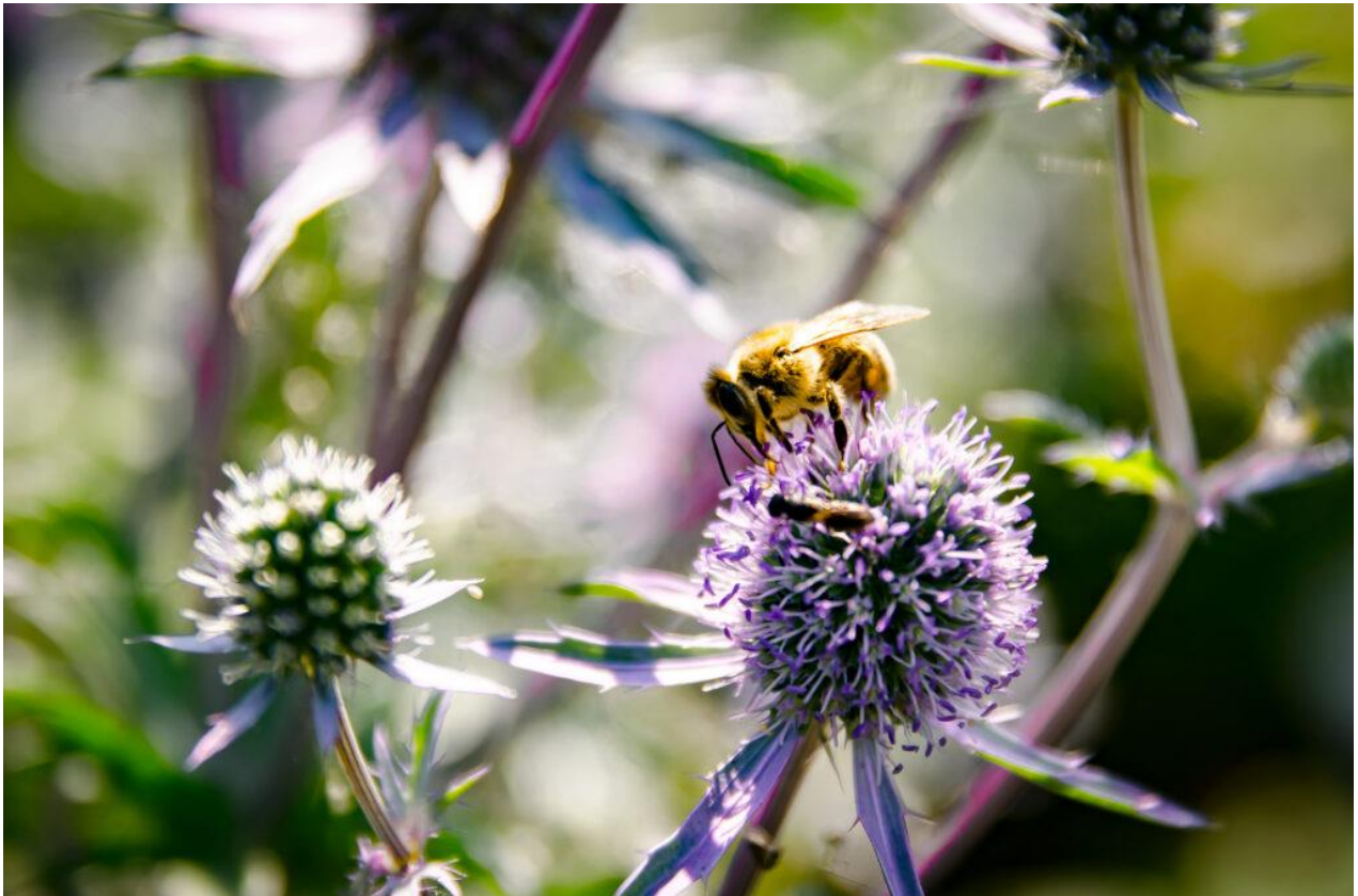
N. Schwarz Gemeinbriefdruckerei